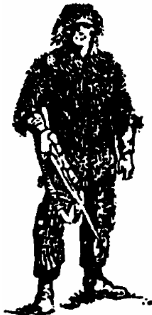
Sylwetka zamaskowana materiałem sztucznym

Przygotuj elastyczne taśmy do przymocowania roślinności (na ręce powyżej łokci oraz na nogi na łydki). Sprawdź, czy wyposażenie nie hałasuje podczas ruchu – podskocz kilka razy. Zamocuj mocno luźne elementy, wypchaj puste przestrzenie watą lub zapasową odzieżą (skarpetami). Zwróć uwagę na naszywki – zamaskuj je opaskami z tkaniny mundurowej lub siatką maskującą.