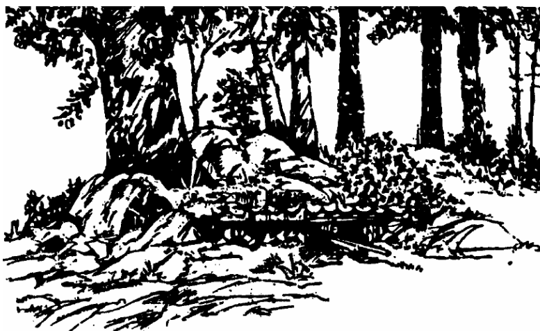
Prawidłowo zamaskowana pozycja bojowa