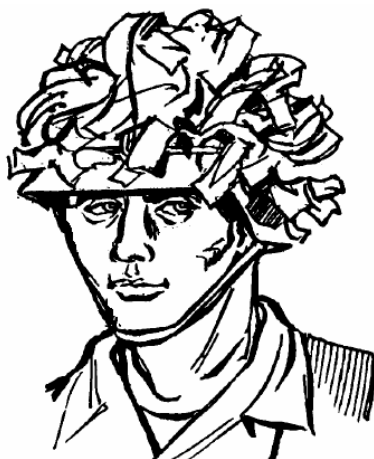
Maskowanie hełmu przy pomocy pasków juty

Zamaskuj hełm kawałkami siatki maskującej oraz tkaniny jutowej, mocując je do siatki lub pokrowca. Kształt hełmu jest jednoznacznie rozpoznawalny i nie występuje w przyrodzie, dlatego konieczne jest jego całkowite zniekształcenie; pamiętaj przy tym, aby elementy maskujące nie przesłaniały pola widzenia.