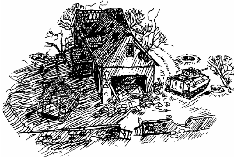
Prawidłowe i nieprawidłowe wykorzystanie cienia do zamaskowania pojazdu