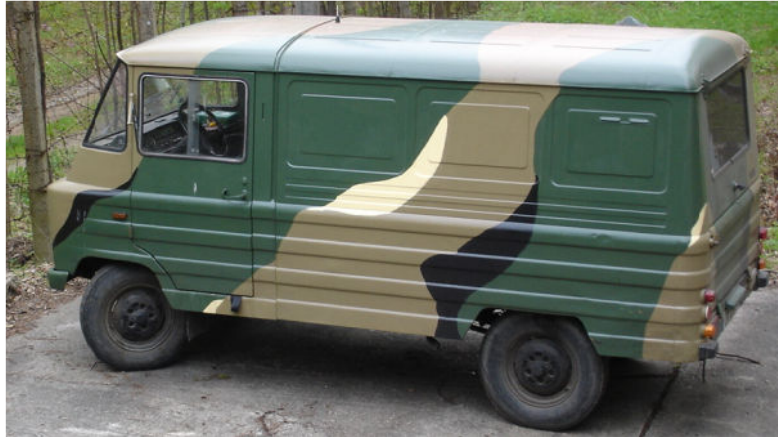
Samochód Żuk pomalowany w standardowy wzór kamuflażu leśnego

Pojazdy są najczęściej pomalowane w uniwersalny wzór maskujący. Jeżeli pojazd nie jest pomalowany w kamuflaż, lub kamuflaż nie odpowiada terenowi, na którym ma on działać, należy uzupełnić malowanie we własnym zakresie. Do malowania używa się farb matowych (efekt matowy uzyskasz dodając do zwykłej farby talku lub mleka w proszku). Kolory powinny być w miarę ciemne i niejaskrawe. W terenie leśnym najlepiej sprawdza się wzór składający się z podłużnych, nieregularnych pasów w kolorach ciemnej zieleni, oliwkowej zieleni, czerni i ciemnego beżu.